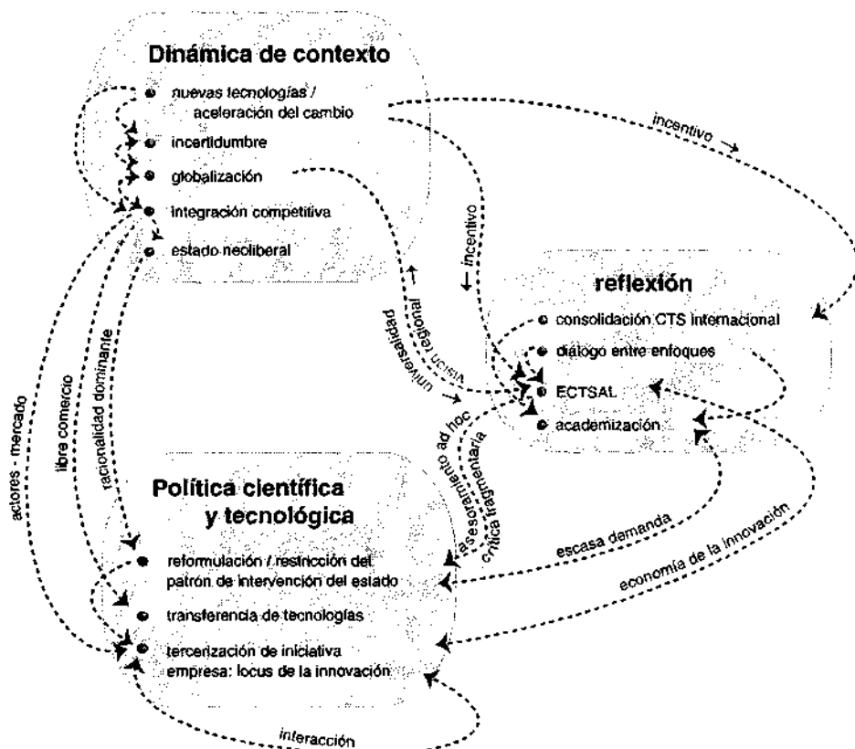
Diagrama 3. Décadas '80-'90

• Uno de los cambios conceptuales fundamentales registrado en el nivel de reflexión en este período fue la transformación del término restrictivo "política de CyT" al sistémico " política de innovación ". 27 Este cambio, y sus implicaciones generales, no llegó a incluirse en la agenda política de los estados latinoamericanos.